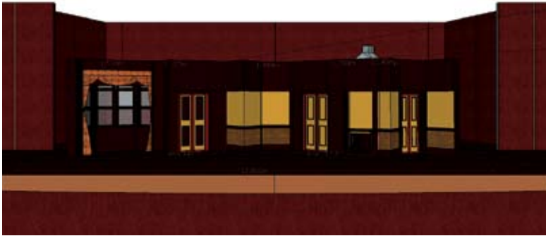
Maquetas do cenário